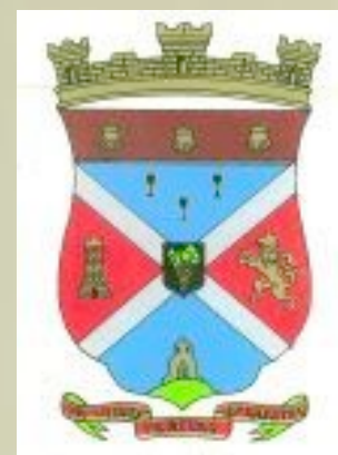
Mairie de Cénac